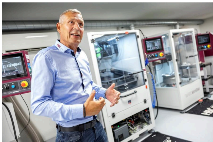
I midten står lakeringsrobotten, som gav det store gennembrud.