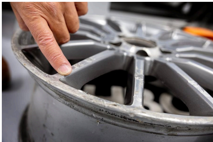
Sådan kan en fælg se ud, når den har fået ridser og skrammer.