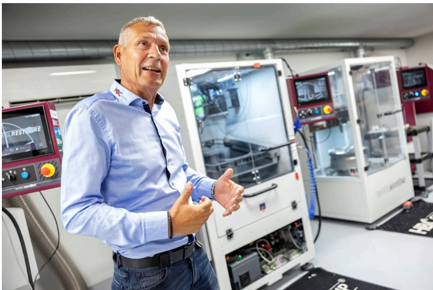
I midten står lakeringsrobotten, som gav det store gennembrud.

De satte sig derfor for at udvikle lakeringsrobotten, som har givet det store gennembrud.